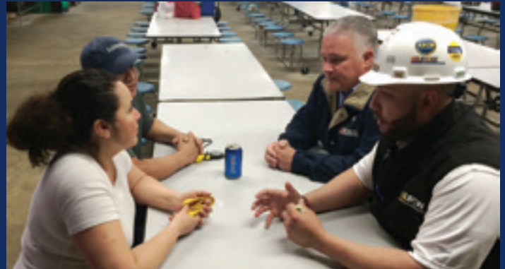
El presidente Young visitó JBS para hablar con los miembros, los participantes de United Citizen Action Network y los ciudadanos recién naturalizados durante sus periodos de descanso.

La clara ruta de Trump hacia la Presidencia es alarmante para muchos (me atrevería a decir para la mayoría) estadounidenses. Y por una buena razón. Él no tiene ninguna comprensión real de lo que se necesita para gobernar nuestro país y sus patrones de comportamiento irracionales no invocan exactamente confianza en su capacidad de liderazgo. Claro, Trump puede parecer alguien con el que uno puede identificarse para las personas con prejuicios que están más enfocados en no dejar que los extranjeros ingresen a nuestro país en lugar de mejorar nuestro futuro. Pero las decisiones que Trump hará tendrán efectos duraderos en cada uno de nosotros: incluidos aquellos que piensan que no tienen nada de qué preocuparse.