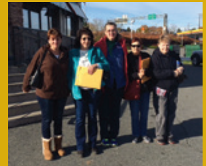
Delegados de Chartwells participaron en la Caminata Laboral GOTV de noviembre de 2015 en Stroudsburg, condado de Monroe.

¿Sabía usted que más de 200 de sus compañeros miembros del Local 1776 ayudan todos los días a alimentar a muchos niños, estudiantes y trabajadores? ¡Es un hecho! El UFCW Local 1776 representa a más de 95 trabajadores de la industria de servicios de alimentos en el Distrito Escolar Mountain (condado de Monroe, Pennsylvania) que son empleados de Chartwells (una división de Compass Group USA.), así como a más de 170 trabajadores de la industria de servicios de alimentos en la Universidad de Bloomsburg (condado de Columbia, Pennsylvania) que son empleados de ARAMARK. El Local 1776 también representa a los trabajadores empleados por Canteen (también una división de Compass Group USA) que laboran en la cafetería en el interior de la planta de carne de res de JBS USA Souderton (condado de Montgomery, Pennsylvania). Estos miembros del Local 1776 trabajan incansablemente para asegurar que los estudiantes y los clientes a quienes les sirven cada día reciben una comida nutritiva para su nutrición y al mismo tiempo ayudar a cumplir las diversas medidas dietéticas establecidas por el Departamento de Agricultura de Estados Unidos; particularmente en el entorno educativo.