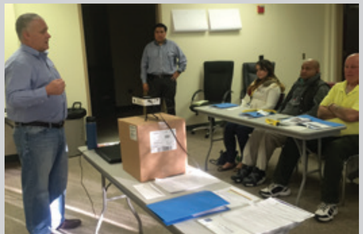
El presidente Young conversando con los delegados en el adiestramiento para delegados.

En Abril, fuimos anfitriones de una conferencia para delegados. La conferencia se llevó a cabo durante el transcurso de dos días en Hershey Lodge en Hershey, Pennsylvania. Todos los delegados de nuestro Local fueron invitados a la conferencia y casi 250 participaron. Había una variedad de talleres educativos dirigidos a ayudar a los delegados a sentirse seguros en el desempeño de sus funciones en sus lugares de trabajo. Gracias a todos los delegados que participaron en la conferencia. Puede leer más sobre la conferencia en la página 16.