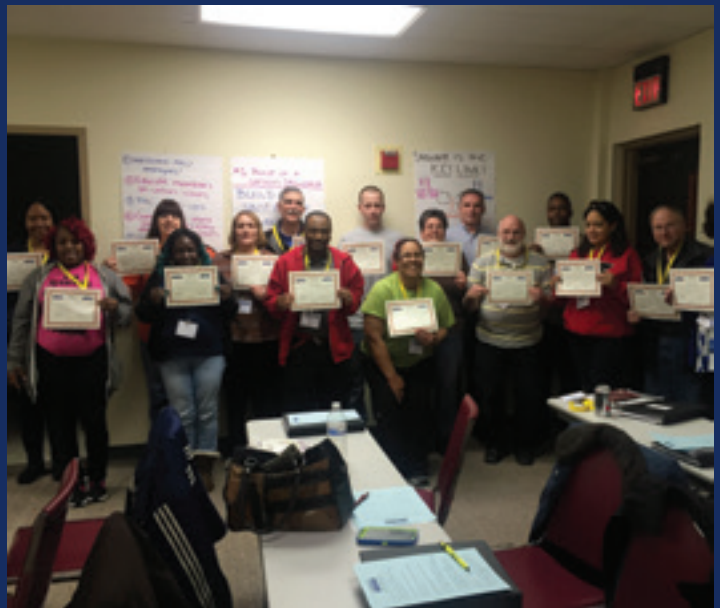
Delegados del Local 1776 sostienen sus certificados al finalizar las clases del adiestramiento de los delegados.

No hemos terminado de buscar maneras de preservar