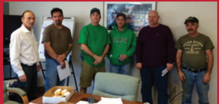
El comité de negociación de DPW