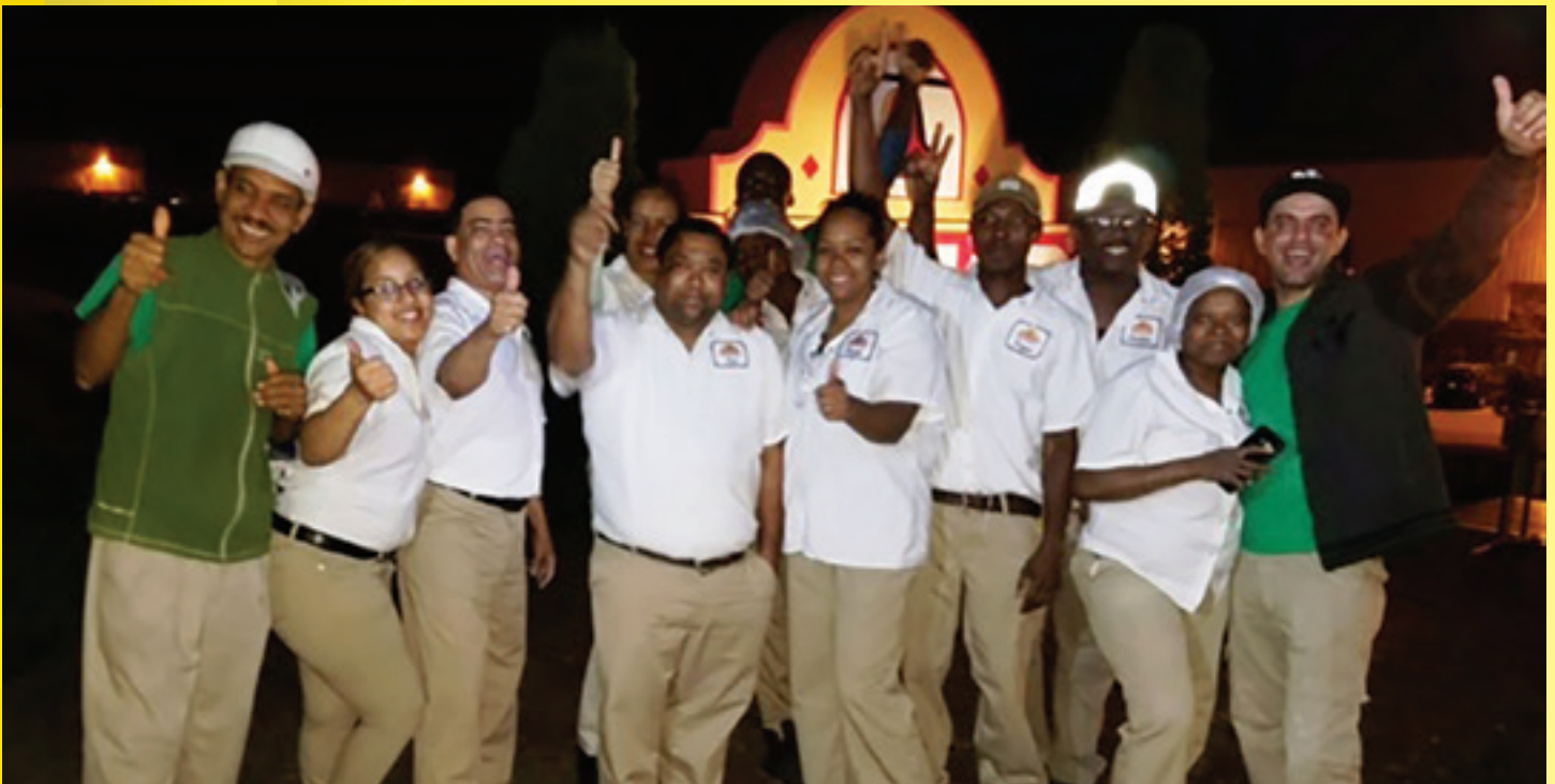
Los trabajadores de Mission Foods se unirán a miles de trabajadores del UFCW Local 1776 de las plantas de embalaje y procesamiento de alimentos en Pennsylvania como Empire Kosher Poultry en Mifflintown, Cargill en Hazelton, JBS en Souderton y Citterio USA en Freeland.