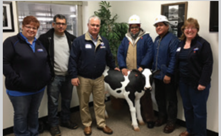
El presidente Young de visita con los miembros de Cargill: una planta de procesamiento de carnes en Hazleton, Pennsylvania.

demuestra. A diferencia de Donald Trump, Hillary tomará en serio el trabajo y podemos confiar en que tomará decisiones basadas en lo que es mejor para los estadounidenses, y no en basa a sus propios sentimientos personales hacia determinadas personas.